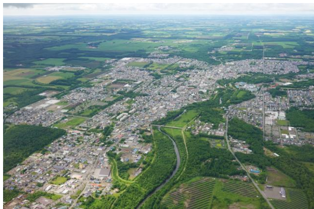
中標津町市街地と周りに広がる酪農地帯