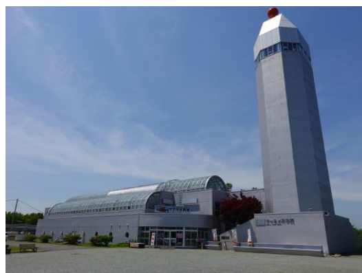
標津サーモン科学館

36m展望塔に巨大イクラ3個が目印の「標津サーモン科学館」では、世界のサケの仲間18種30種類以上が展示され、その種類数は日本一です。