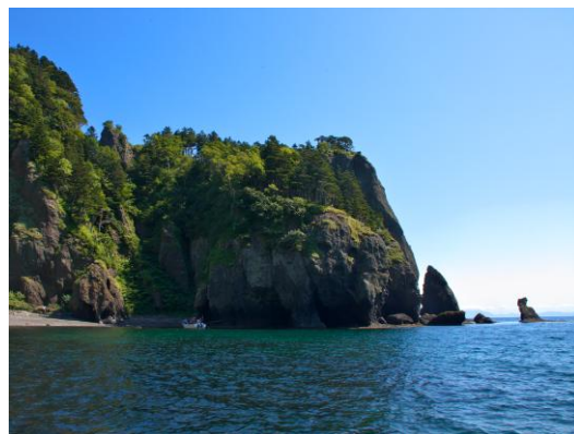
世界自然遺産 知床

また、一年を通して様々な動物と出会う可能性がある洋上でのシャチ・クジラ・イルカ・バードウォッチング、日本百名山にも選ばれた羅臼岳登山、トレッキング、スキューバダイビングなど海から山まで自然を対象としたアクティビティも豊富です。